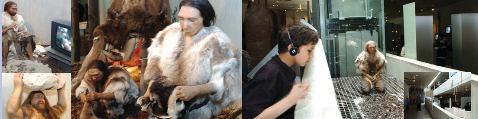
STIFTUNG NEANDERTHAL MUSEUM Träger des Museums ist die Stiftung Neanderthal Museum. Stiftung und Museum finanzieren sich vor allem aus den Erlösen des Museumsbetriebes, aus Spenden und Zustiftungen.

Ausstellung und Architektur des Museums wurden national und international mehrfach preisgekrönt.